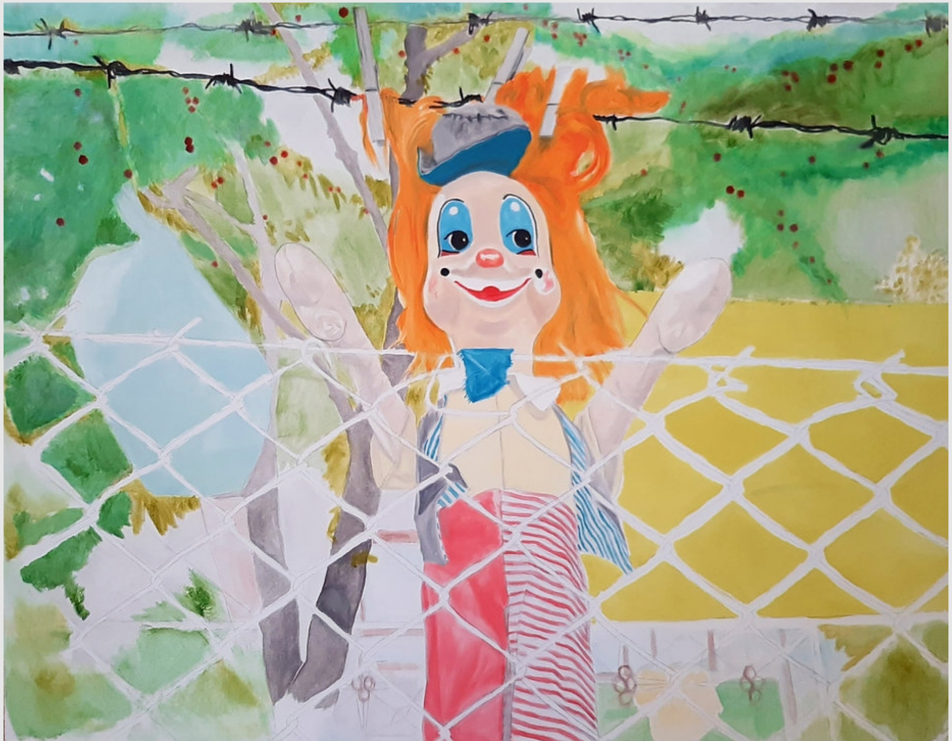
Jestem otwarta, 130x100cm, olej na płótnie