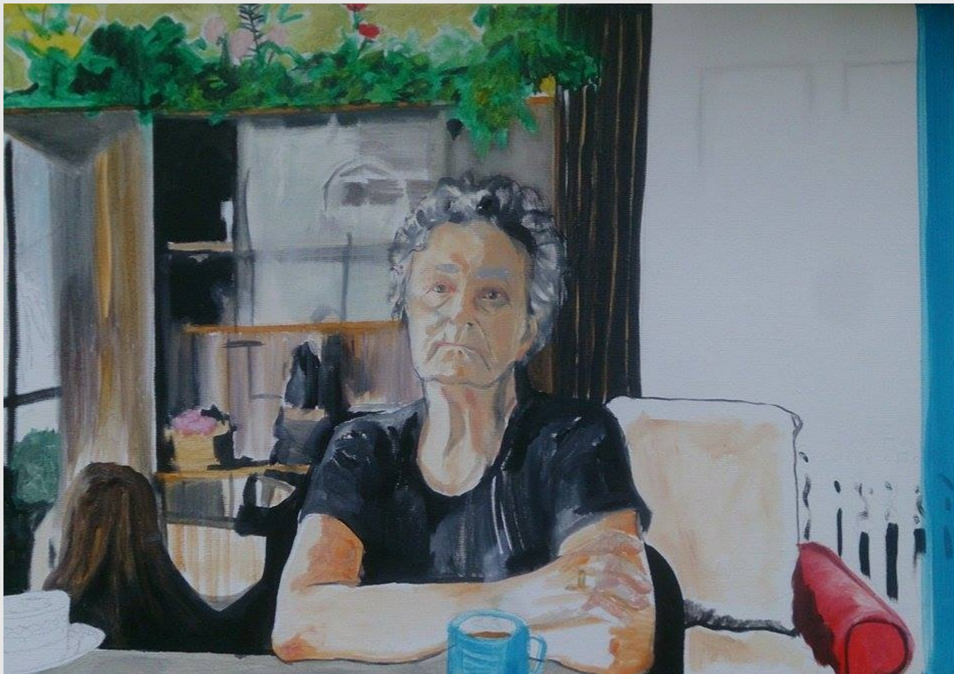
30 maj. Komu pójdiesz na skargę?, 50x70cm, olej na płótnie