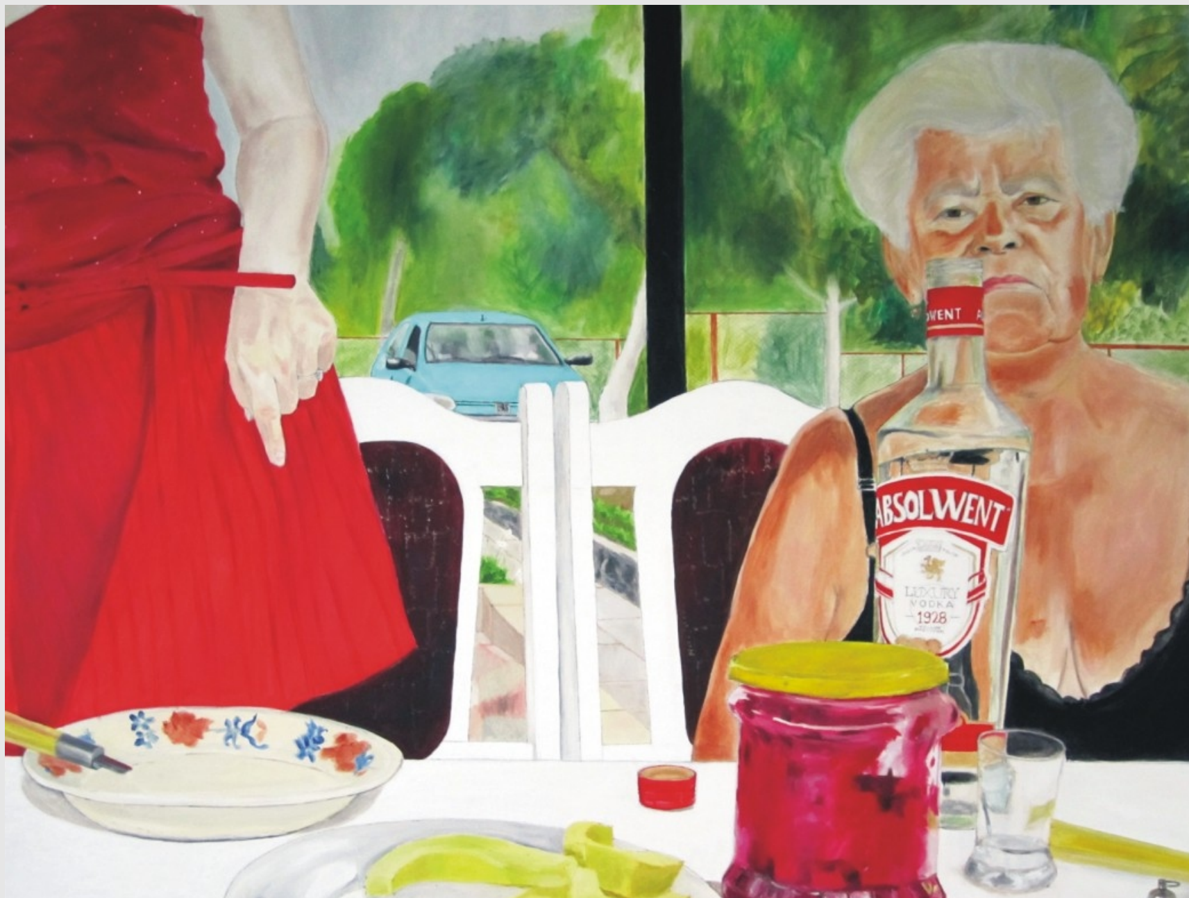
Niby źle, a jednak dobrze, 130x100cm, olej na płótnie