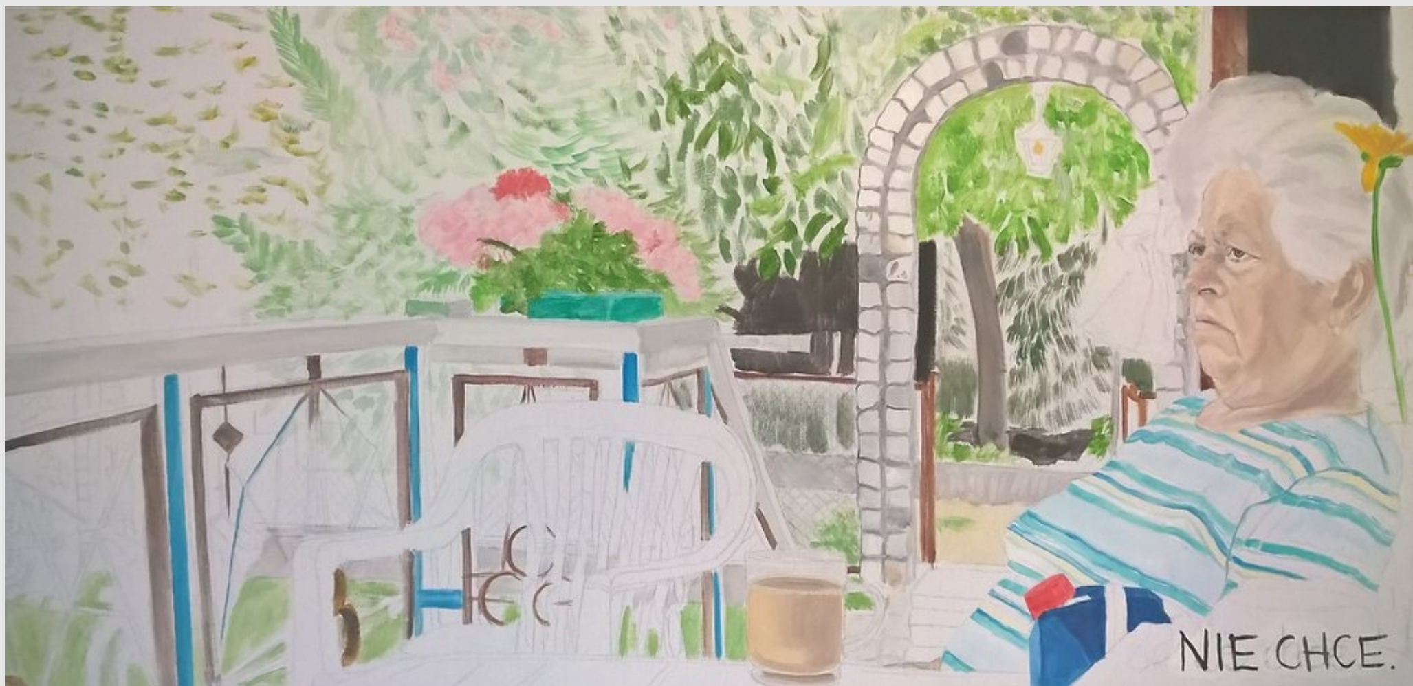
NIE CHCE., 100x50cm, olej na płótnie