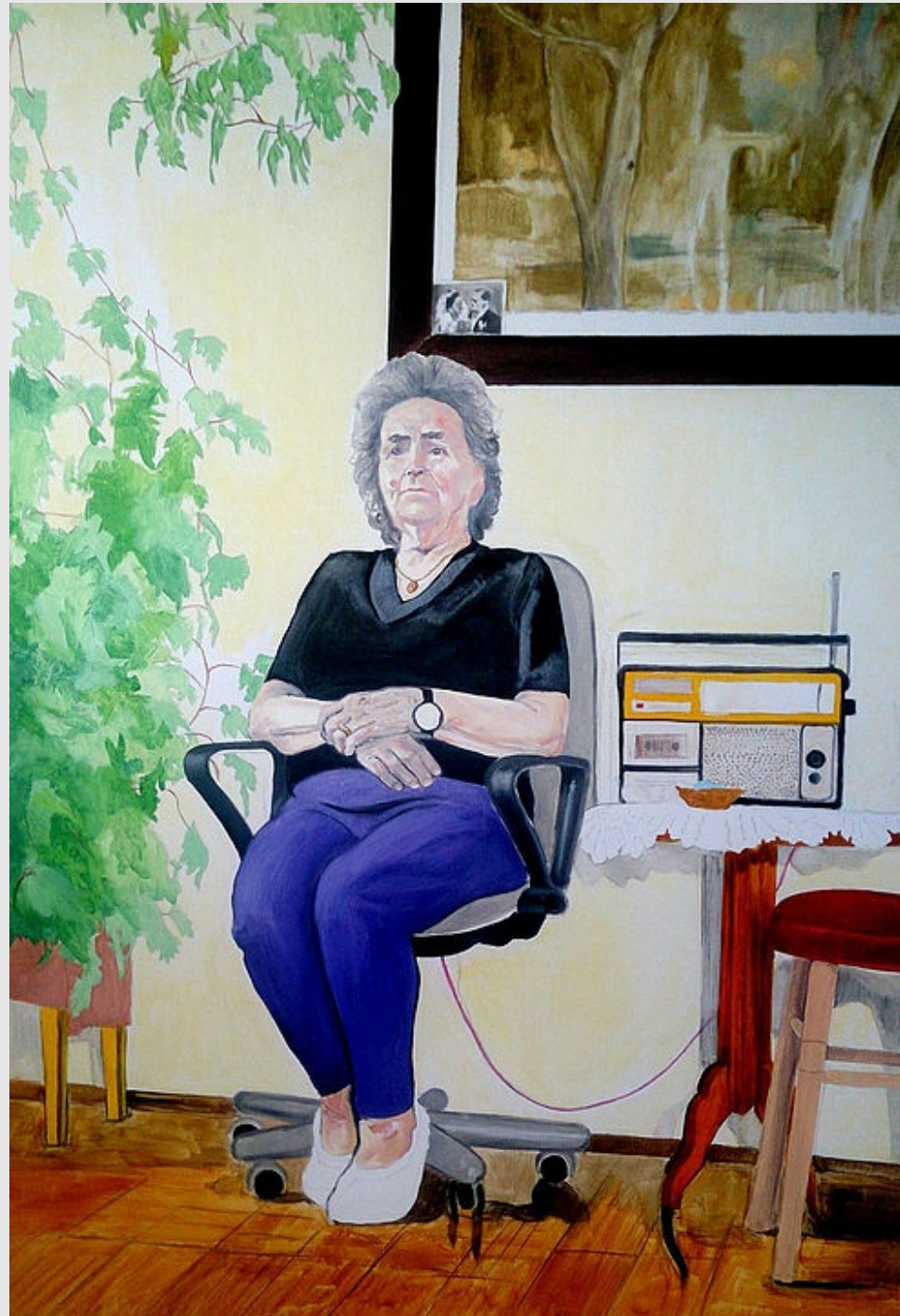
Nowe życie , 140x100cm, olej na płótnie