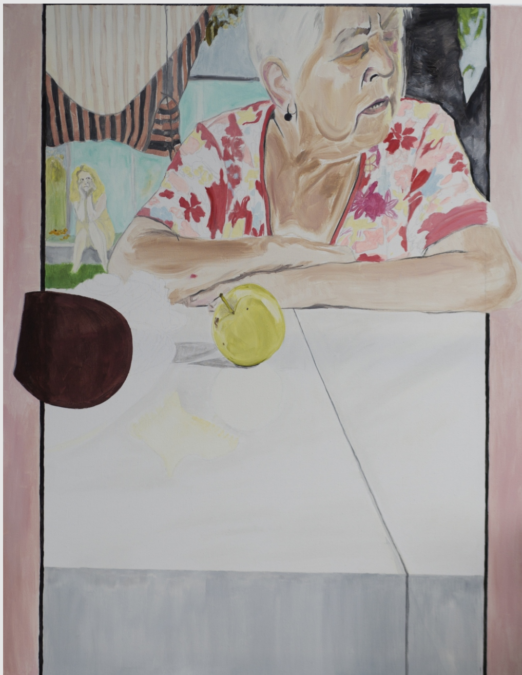
Mamo? Kocham, to co mam ,90x70cm, olej na płótnie