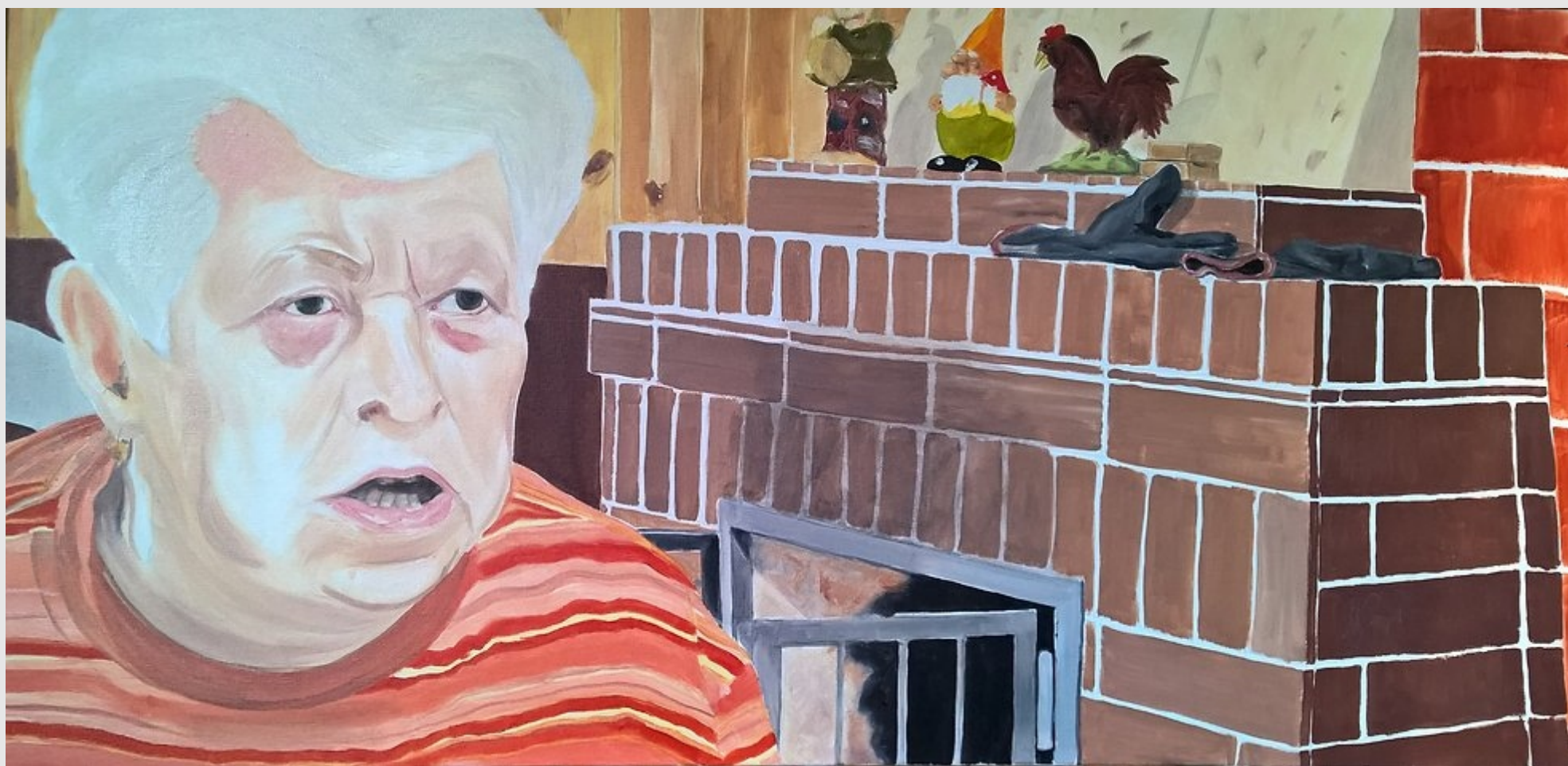
Piromanka, 100x50cm, olej na płótnie