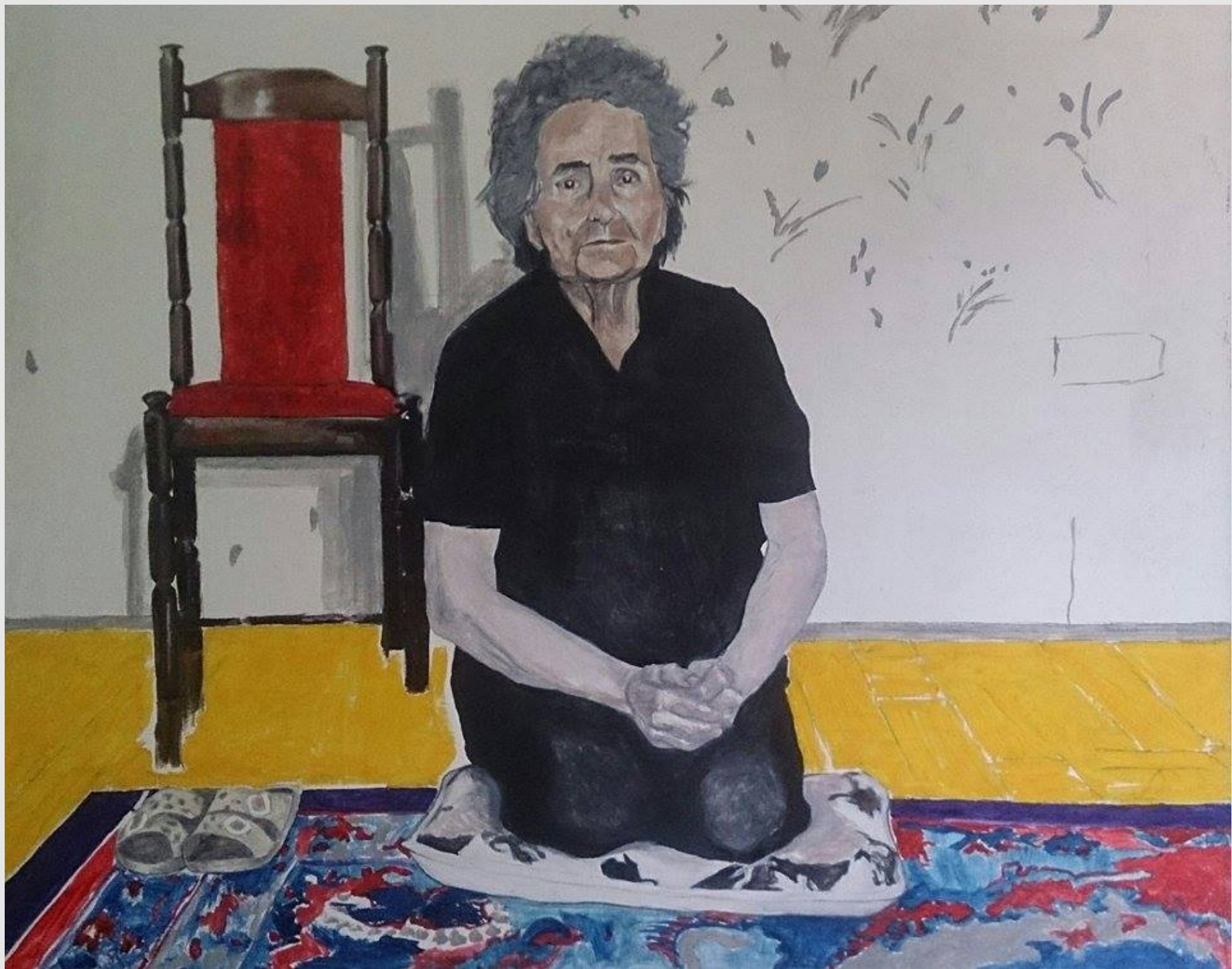
Nie ma już dziadka, 120x100cm, olej na płótnie