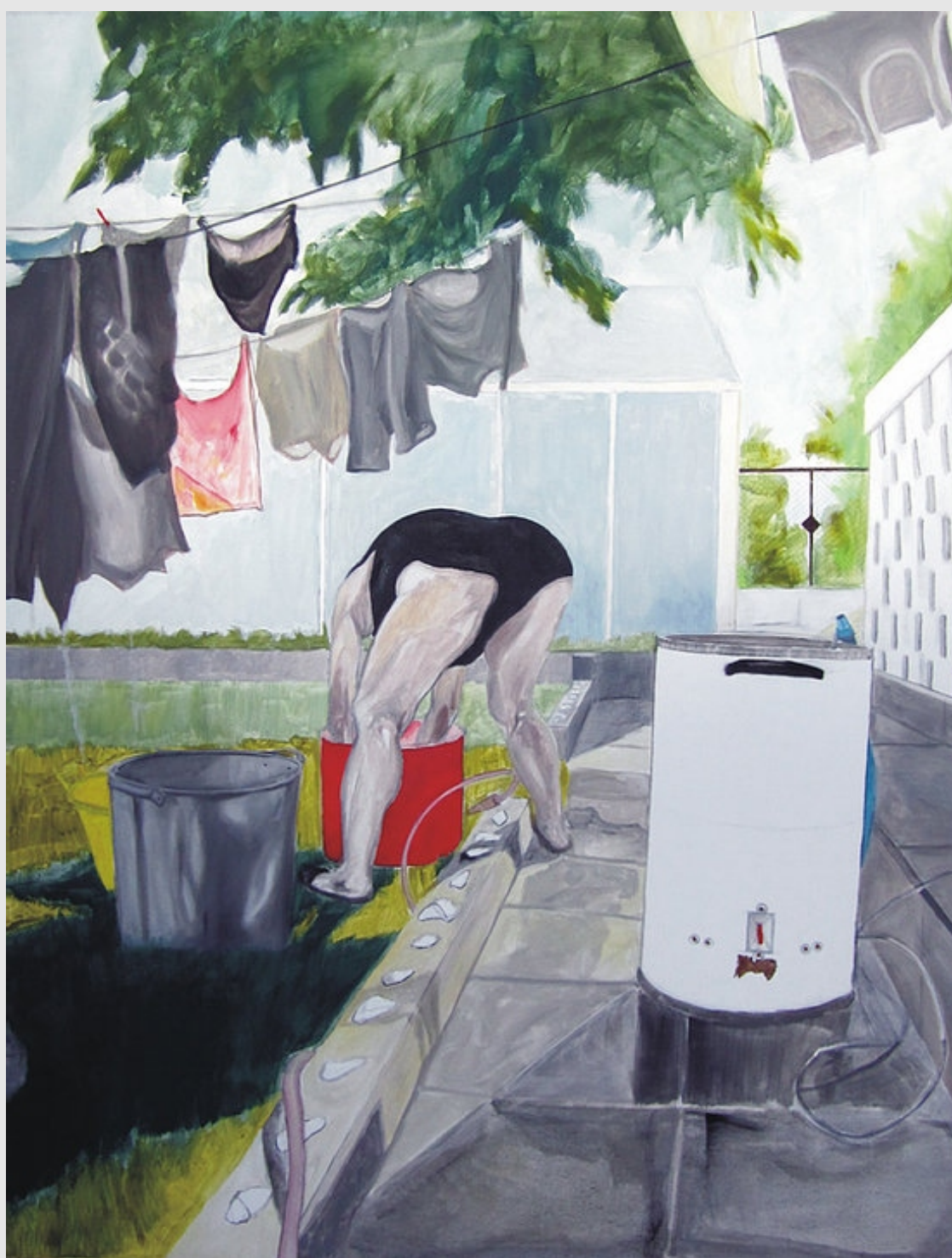
Francia I, 130x100cm, olej na płótnie