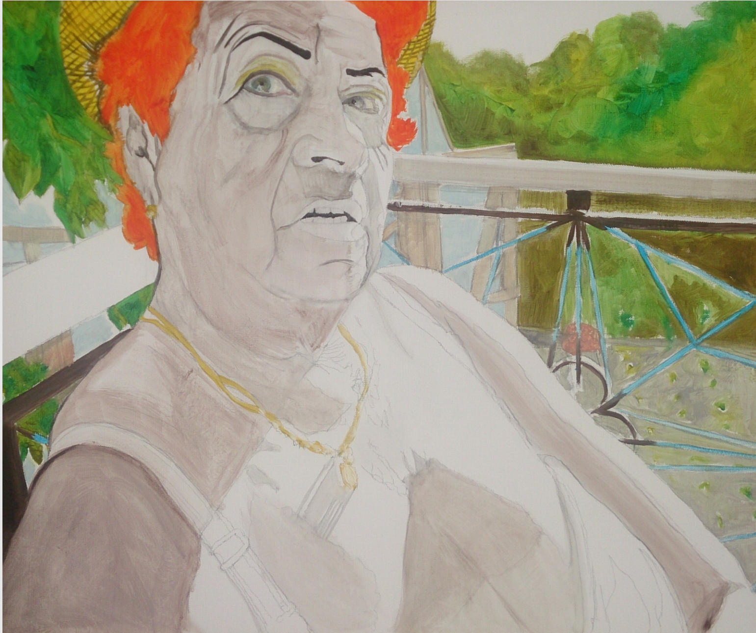
O Boże, są tacy ludzie ,40x50cm, olej na płótnie