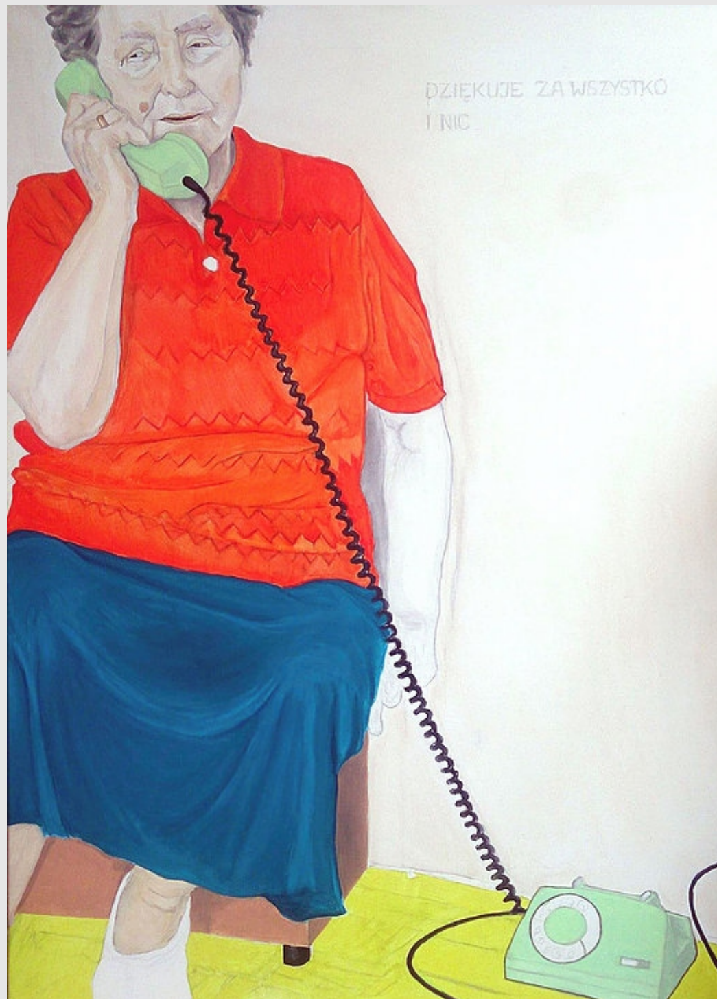
Dziękuję za wszystko i nic, 100x73cm, olej na płótnie