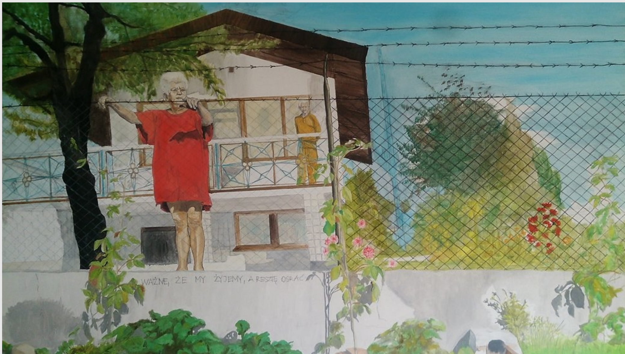
Ważne, że my żyjemy, a resztę osrać, 140x80cm, olej na płótnie