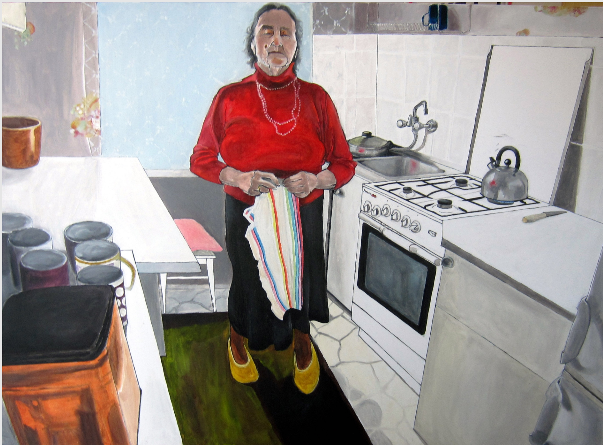
Czekając na wrzątek , 100x73cm, olej na płótnie