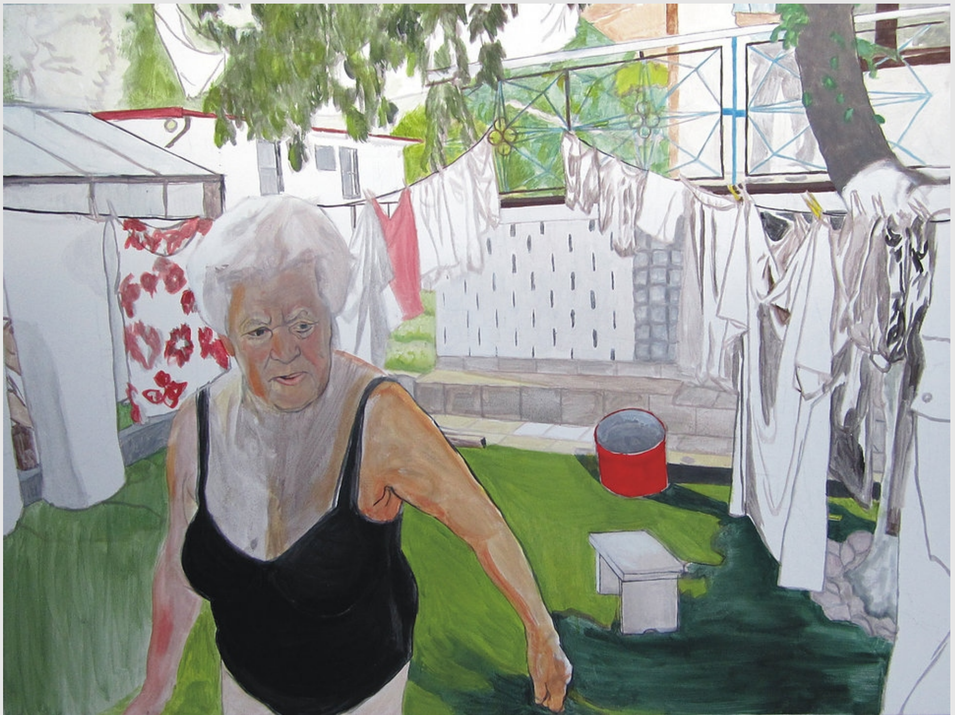
Frania II, 100x120cm, olej na płótnie