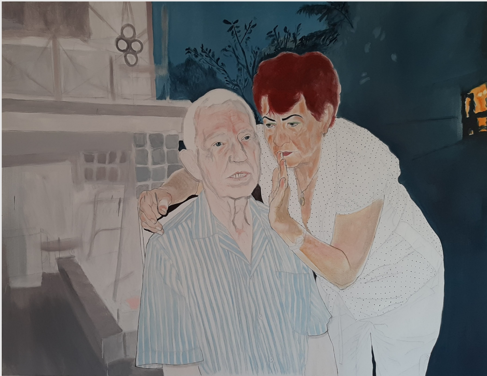
Te, te, te, te, te., 130x100cm, olej na płótnie