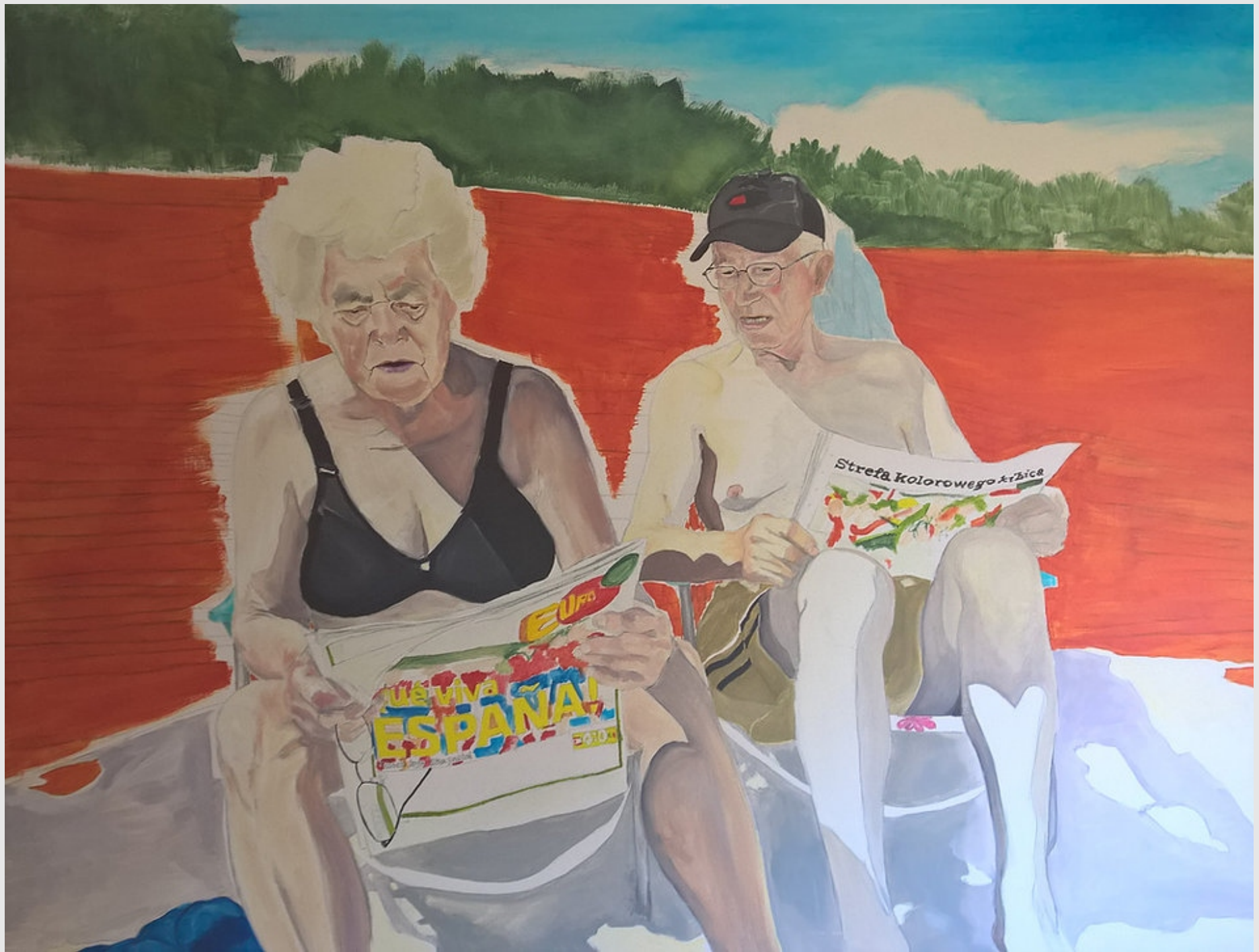
Parawan, 130x100cm, olej na płótnie