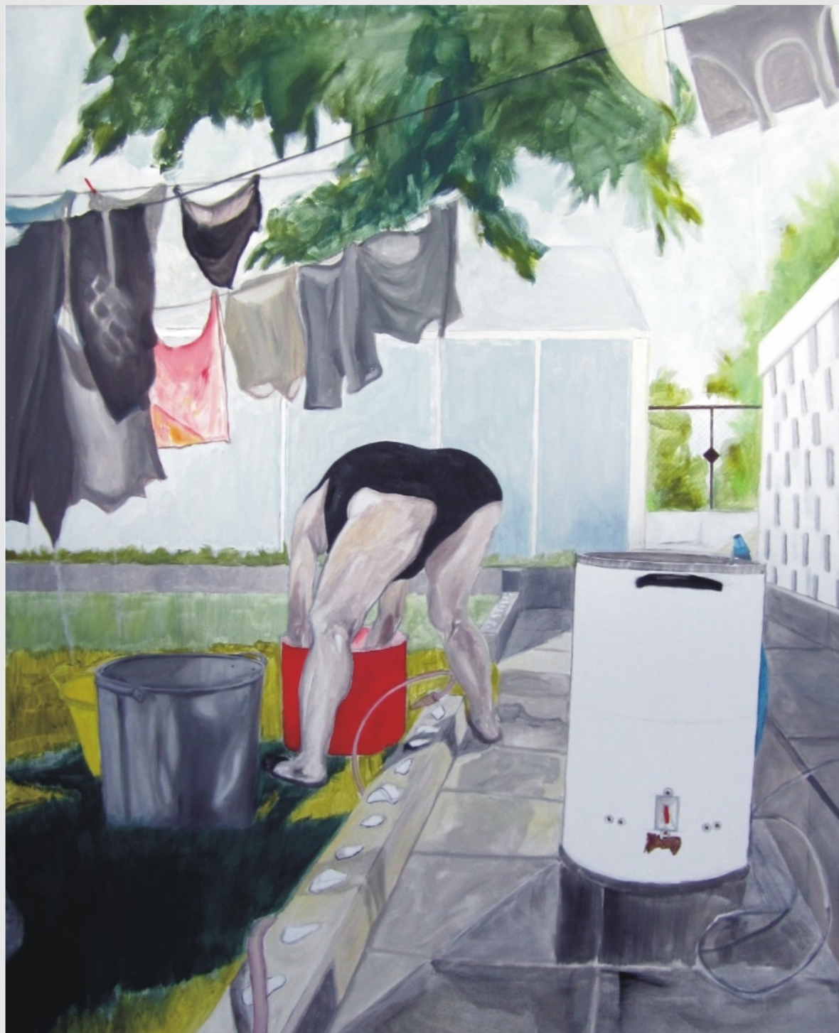
Francia I ,130x100cm, olej na płótnie