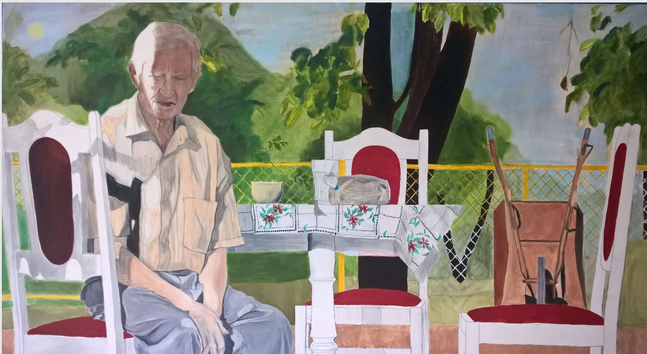
Cieszymy się radością życia ,150x85cm, olej na płótnie