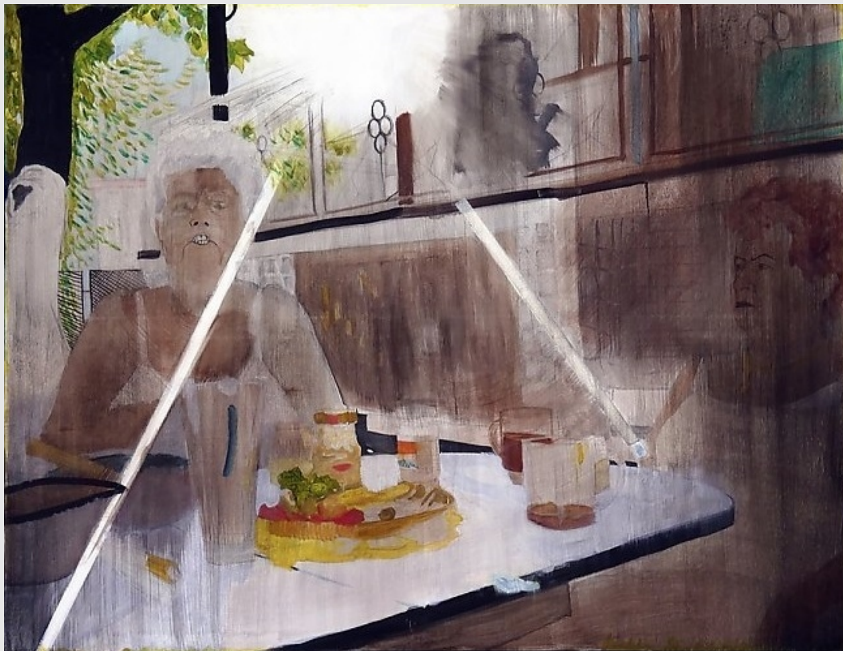
Santa Anna ,130x100cm, olej na płótnie