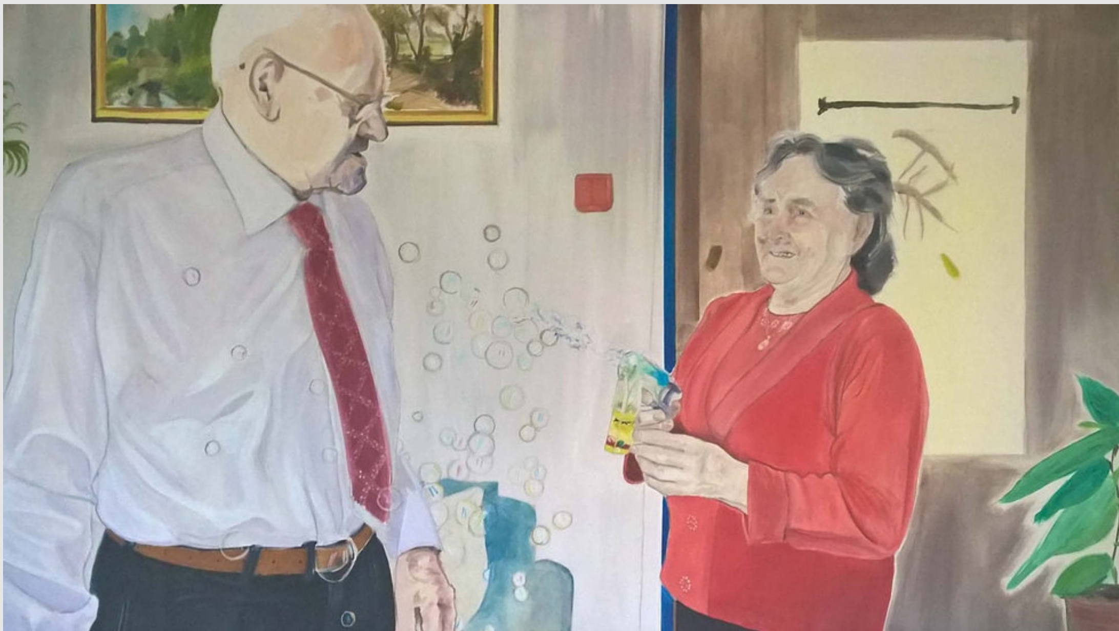
Średnia żona byłaś, 140x80cm, olej na płótnie