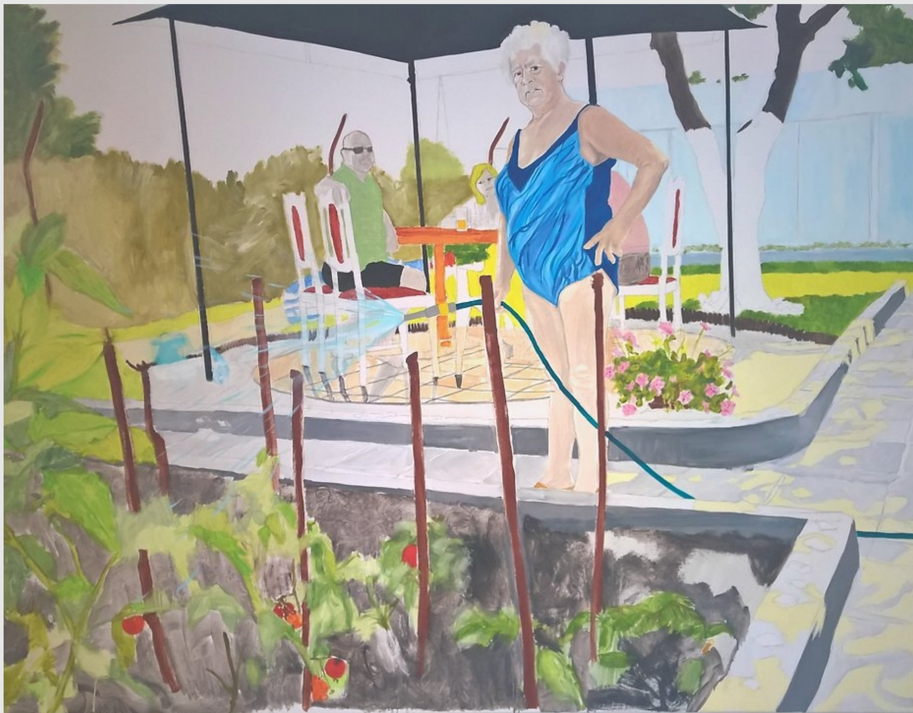
Jak czekasz? ,130x100cm, olej na płótnie