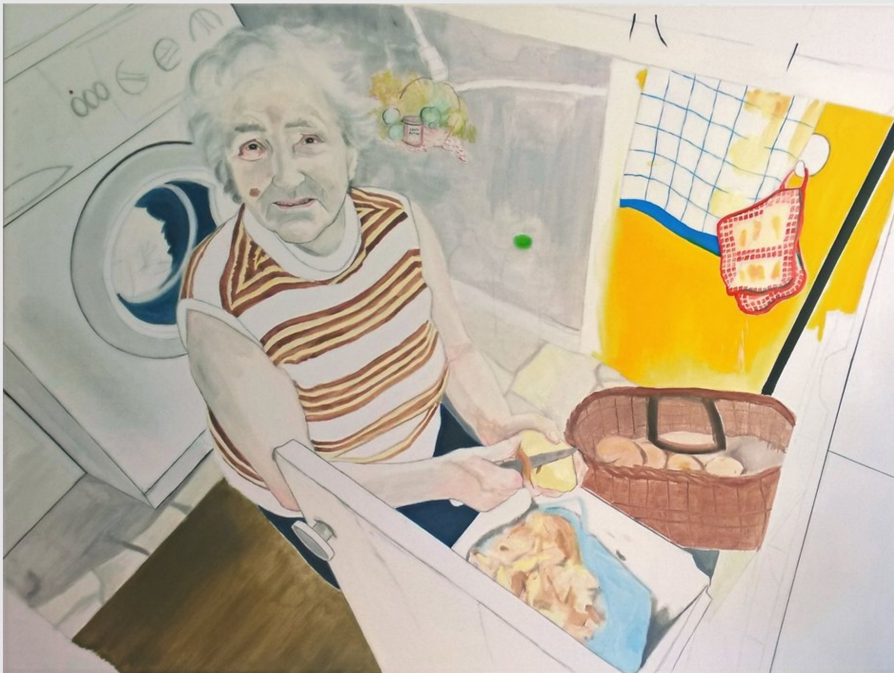
Obierająca kartofle , 130x100, olej na płótnie