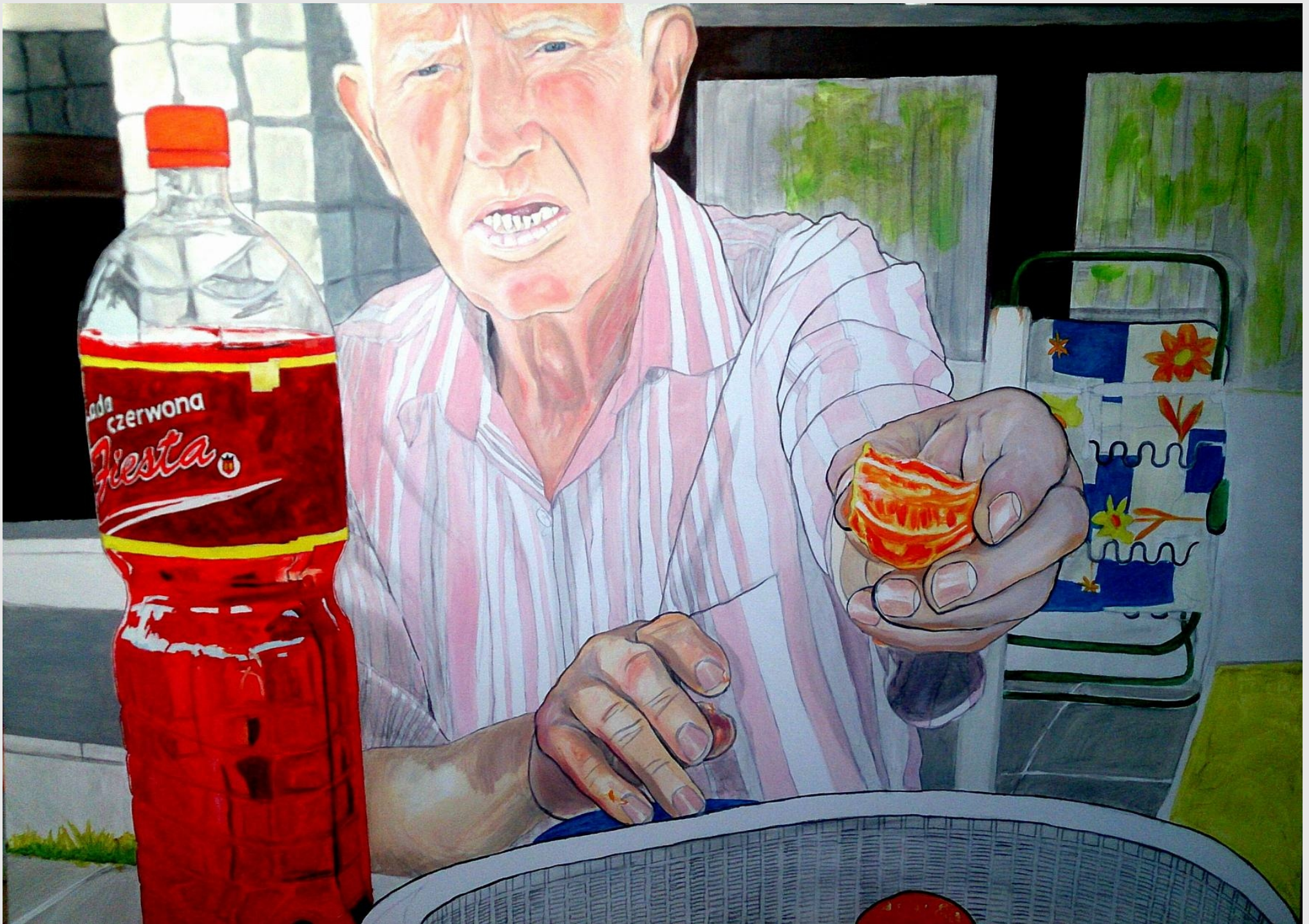
Dziękuję!, 140x100cm, olej na płótnie